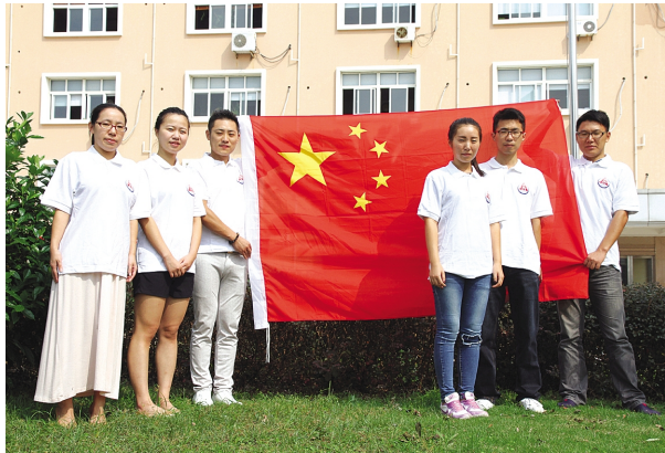
团员青年与国旗合影