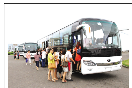
集团公司积极执行淘汰“黄标车”的规定，8月份花260多万元订购了4辆大巴车作为接送员工上下班班车。9月28日，新大巴车第一天投入使用。

5S管理虽然推行的时间不长，但各单位都开始了行动并带来新的变化，比如现在你走过晶和公司机修房门口时就会发现，内部已经发生了不小的改观。