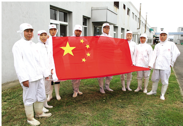
晶和公司外来务工人员与国旗合影

国庆前夕，集团公司党委组织开展了“我和国旗合个影”活动，旨在激发公司广大职工爱国、爱家、爱社会、爱企业的情感，祝福中华民族繁荣昌盛，祝福祖国明天更加美好。